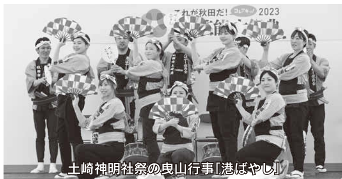
土崎神明社祭の曳山行事「港ばやし」