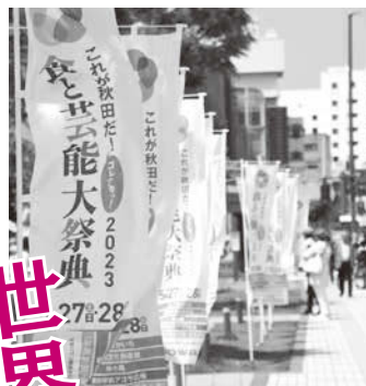
釜ヶ台番楽(にかほ市)