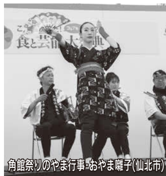
角館祭りのやま行事・おやま囃子(仙北市)