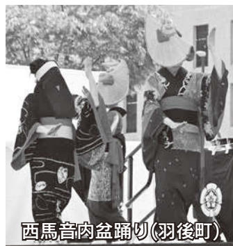
西馬音内盆踊り(羽後町)