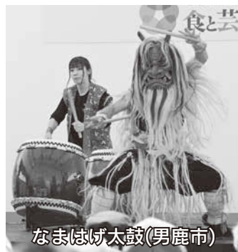
なまはげ太鼓(男鹿市)