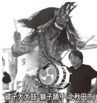
綴子大太鼓・獅子踊り(北秋田市)