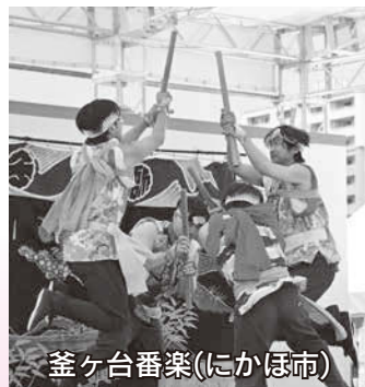
釜ヶ台番楽(にかほ市)

秋田の「食と芸能」が中心市街地に大集合！ 今年は「竿燈演舞ストリート」と題して、 仲小路を舞台に竿燈の演技を行います。 秋田を味わい尽くす2日間！ ぜひ、お越しください！