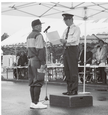
表彰を受ける小型ポンプ操法の部で優勝した河辺第三分団の代表