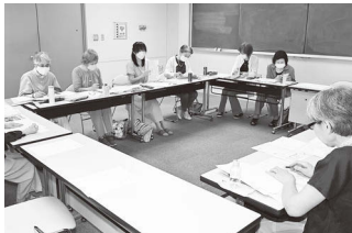
研修で伝え方を研究